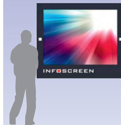
Infoscreen / Video-Board

* Die 1-2-3-Plakat-Kopfleiste wird automatisch oberhalb von Ihrem Motiv eingefügt.